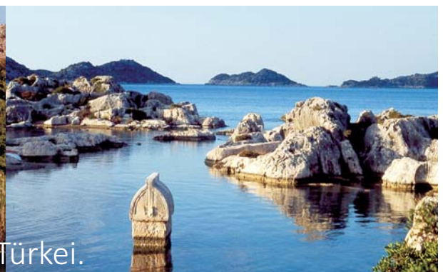
Gewässer mit Vergangenheit. Türkei.